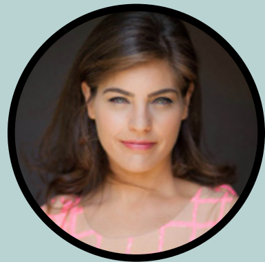
נועה רבין // עיבוד ובימוי