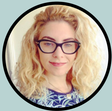
קארין בראון // קומאי // עיצוב תפאורה ותלבושות