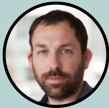
זיו ולושין // עיצוב תאורה

במאית, שחקנית תאטרון, קולנוע וטלוויזיה ומנהלת את המעבדה לאמנות עכשווית – רדליין. בוגרת התיכון לאמנויות ע"ש תלמה ילון, סיימה בהצטיינות לימודים תלת שנתיים בסטודיו למשחק ע"ש ניסן נתיב בתל אביב, למדה בימיו בתאטרון המעבדה במוסקבה בניהולו של הבמאי אנטולי ואסילייב, השתלמה בתאטרון השמש בפאריז בניהולה של הבמאית אריאן מינושקין ובוגרת הקורס לניהול תרבות ואמנות באוניברסיטת תל אביב ולהב בניהולה המקצועי של נעמי פורטיס. ב- 2009 ייסדה את תאטרון דימונה ושימשה כמנהלת האמנותית של התאטרון עד שנת 2015.