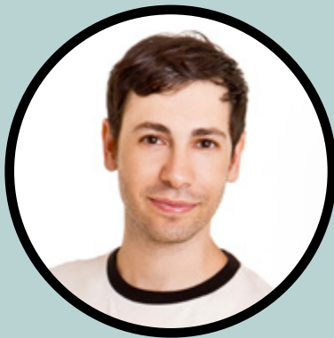
מאור ציב // עיצוב תפאורה ותלבושות